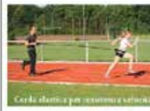
Carda elastica per resistenza e velocità