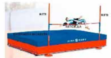
Pedana completa di salto in alto per l'esterno

SE UN'AZIENDA/ISTITUZIONE? CONTRIBUISCI NELLA CRESCITA DELL'ATLETICA LEGGERA NEL TERRITORIO DELL'UNIONE TERRITORIALE DELLE VALLI E DOLOMITI FRIULANE, IL PROSSIMO ACQUISTO PREVISTO PER IL MESE DI MARZO 2017 NECESSARIO PER L'ATTIVITA' DI ATLETICA LEGGERA: