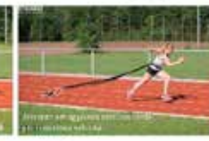
Strumenti per diagnosi e valutazione